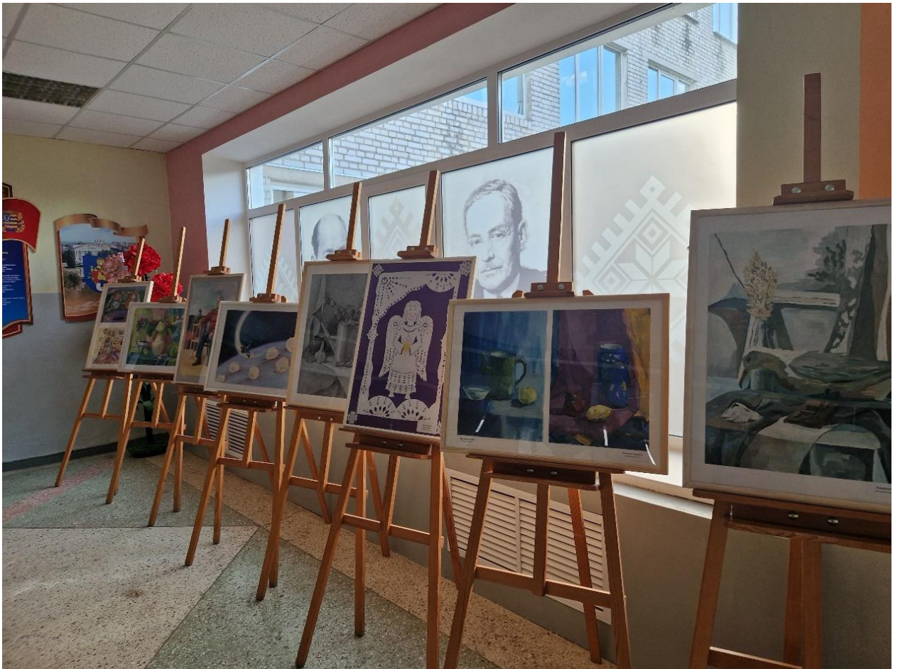
На базе ГУО "СШ №2" прошла выставка рисунков "Радуга вдохновения"